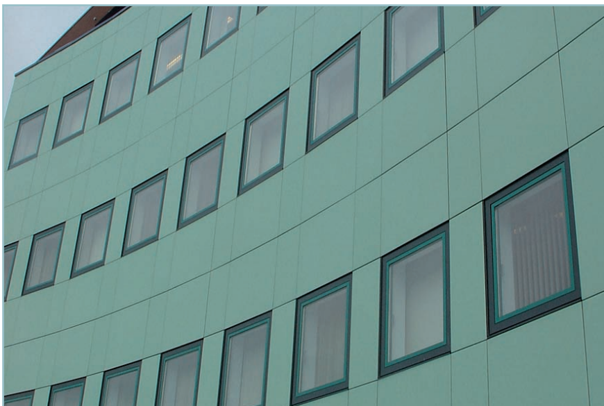
Product: Structureel glas + achterconstructie Leverancier: Tweha Website: www.tweha.nl